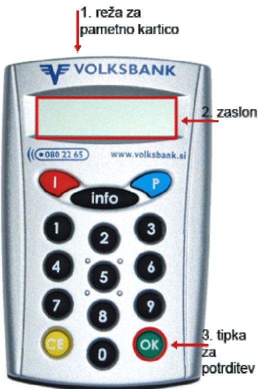
Čitalec Digipass 810

Ob vsakokratnem generiranju enkratnega gesla kartica od vas zahteva vnos vaše osebne številke PIN. Na ta način je zagotovljeno, da lahko enkratno geslo uporabi samo lastnik kartice.